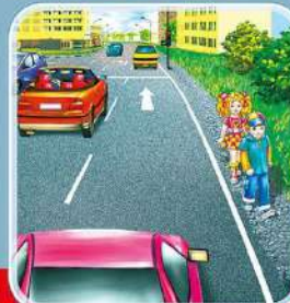
Если пешеходная дорожка отсутствует, то идти нужно по обочине дороги навстречу движению транспорта.