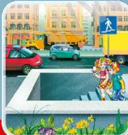
Если есть подземный переход, то дорогу нужно переходить по нему.