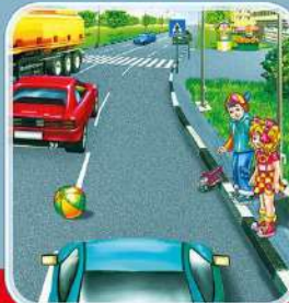
Нельзя играть на проезжей части или рядом с ней. Это опасно для жизни!

Используй ФЛИКЕР, чтобы быть заметнее на дорогах