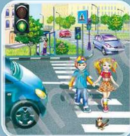
Зелёный сигнал светофора обозначает, что переходить дорогу можно.