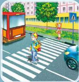
Переходя дорогу, нужно сначала посмотреть налево, а посередине дороги — направо.