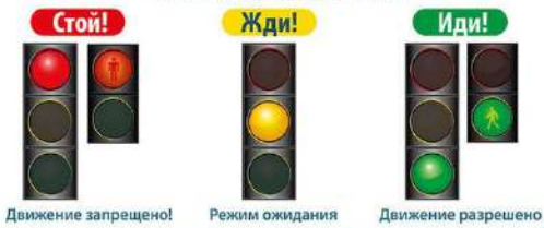
Движение запрещено! Режим ожидания Движение разрешено