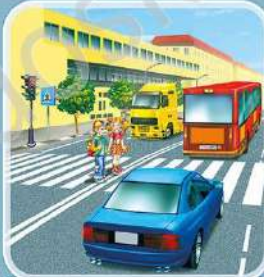
Если красный сигнал светофора застал на середине дороги, следует остановиться на разделительной полосе и дождаться зеленого.