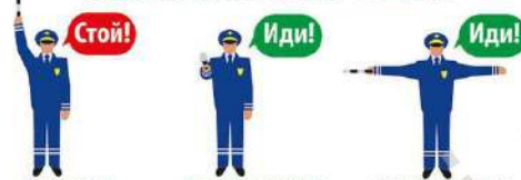
Движение всех транспортных средств и пешеходов запрещено во всех направлениях. Пешеходам разрешено переходить проезжую часть дороги за спиной регулировщика. Пешеходам разрешено переходить проезжую часть с левой и правой сторон.