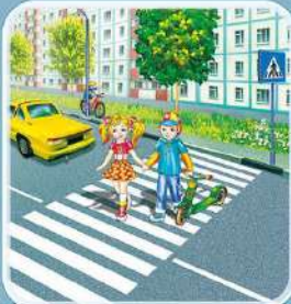
Переходить дорогу нужно по пешеходному переходу — «зебра».